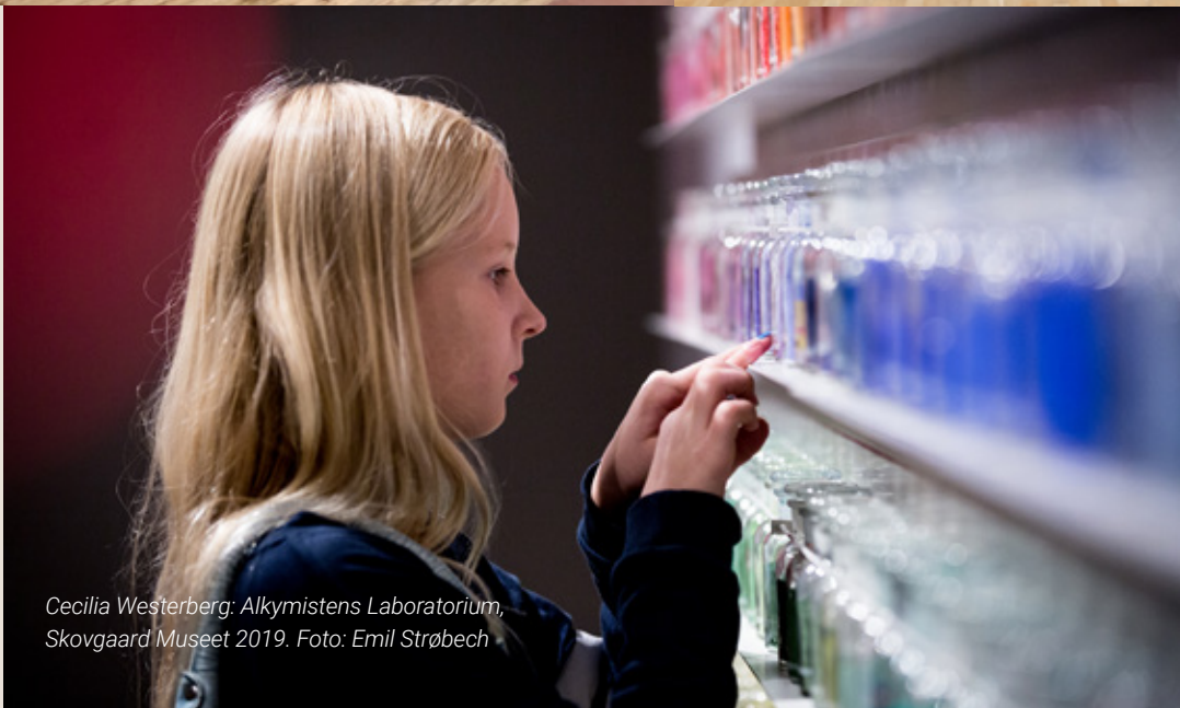
Cecilia Westerberg: Alkymistens Laboratorium, Skovgaard Museet 2019.