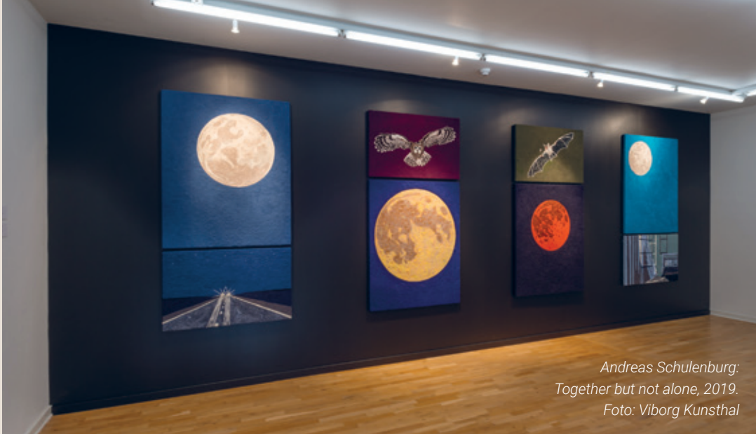
Andreas Schulenburg: Together but not alone, 2019.