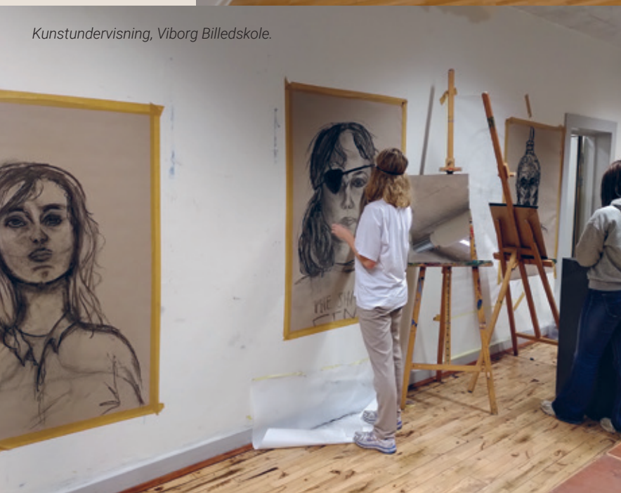
Kunstundervisning, Viborg Billedskole.